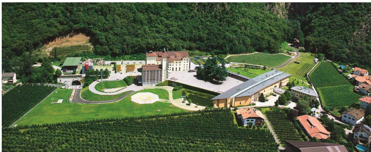
Sede dell'Unione provinciale e area della Scuola provinciale antincendi

La Scuola provinciale antincendi dispone di uno specifico edificio scolastico con quattro aule tecnicamente moderne e attrezzate. I partecipanti ai corsi possono usufruire della mensa e pernottare negli appositi alloggi. Per la formazione pratica è disponibile un'area di 3,5 ettari con specifici impianti da esercitazione, tra cui la casa-incendi alimentata a gas, la stazione del principio di incendio, il tunnel e i binari da esercitazione. Laboratori interni provvedono alla cura e manutenzione degli estintori, degli autorespiratori, degli strumenti di misura e delle tute per la protezione chimica.