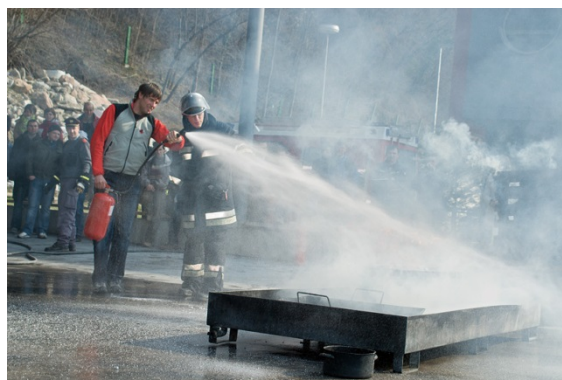
Corsi antincendio - Formazione teorica e pratica