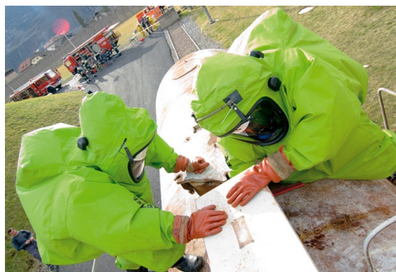
Corso sulle sostanze pericolose

La Scuola provinciale antincendi effettua dal 1995 anche i corsi antincendio con il relativo esame di accertamento dell'idoneità per datori di lavoro e dipendenti che devono attuare le misure di prevenzione e lotta antincendio e gestire le emergenze ai sensi delle norme in materia di sicurezza sul lavoro. Al superamento dell'esame, l'ufficio competente rilascia loro l'attestato di idoneità tecnica. Dal 2012 vengono proposti anche i corsi di