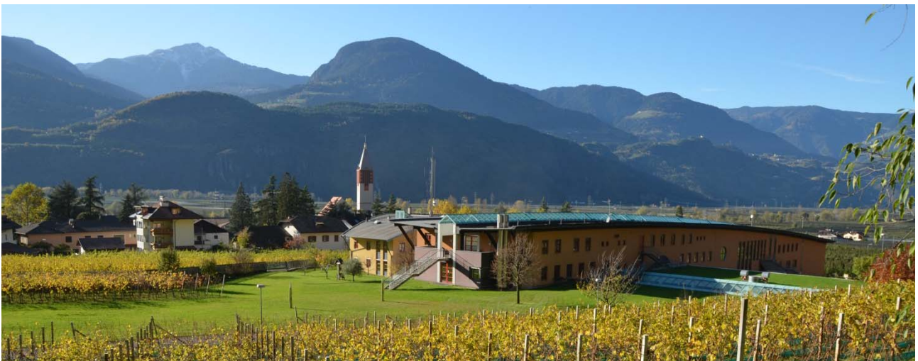
Sede dell'Unione provinciale e area della Scuola provinciale antincendi

Complessivamente, sono circa 7.200 le persone che ogni anno effettuano la formazione presso la Scuola provinciale antincendi.