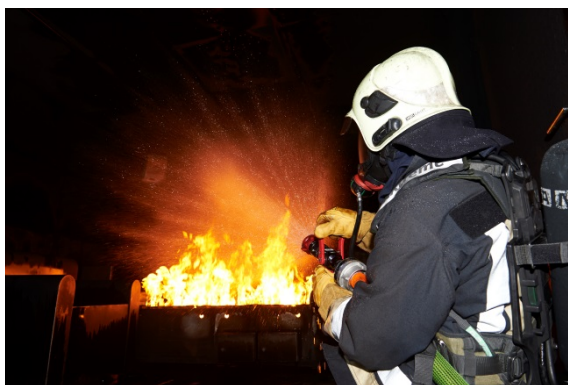
Formazione nella casa-incendi

La formazione viene costantemente migliorata e adeguata allo stato della tecnica e della tattica d'intervento. Con l'ultimazione dei nuovi edifici nel 2002, oggi a Vilpiano ci sono impianti adeguati per una formazione moderna e coerente con la realtà degli eventi.